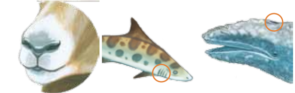
nariz/boca branquias espiráculo

1 Los animales necesitan oxígeno para respirar. La mayoría de los animales respiran oxígeno a través de sus hocicos o narices, los peces utilizan sus branquias, y algunos mamíferos marinos (delfines y ballenas) suben a la superficie del agua y respiran el oxígeno utilizando sus orificios nasales.