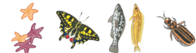
estrellas de mar mariposa peces escarabajo

Los invertebrados no tienen espina dorsal ( vértabras ) en ninguna etapa de sus vidas. Ellos viven en todos los hábitats, inclusive en las profundidades del océano. ¿Cuáles de éstos no es un invertebrado?