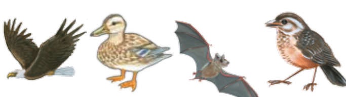
águila pato murciélago petirrojo

Todos los pájaros tienen plumas y alas pero no todos vuelan. ¿Cuál de éstos no es un pájaro, pero un mamífero volador?