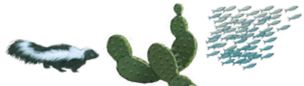
rociar espinas cardumen

3 Los seres vivos tienen partes del cuerpo o ciertas conductas para protegerse de depredadores o de cosas que los puedan lastimar.