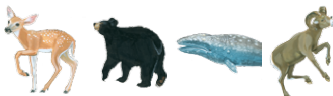
venado oso ballena musmón

Todas las crías mamíferas beben leche de sus madres y obtienen el oxígeno del aire. ¿Cuáles de estos mamíferos viven en el océano?