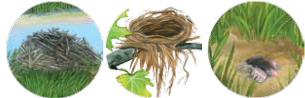
madriguera nido excavar

2 Todos los animales crían a sus bebés en madrigueras, nidos o guaridas.