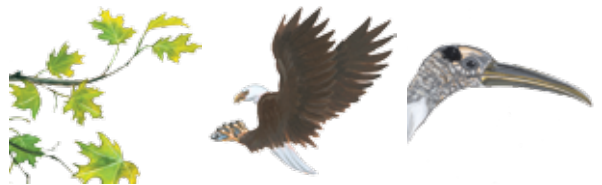
hojas verdes garras pico/boca

5 Todos los seres vivos necesitan energía para crecer y tienen partes del cuerpo que les ayudan a obtener su comida.