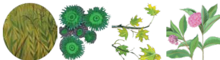
hierba anémonas hojas asclepia

Las plantas se encuentran al final de la red alimenticia. ¿Cuál no es una planta?