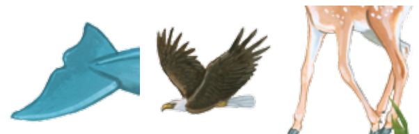
aleta caudal alas patas y pies

4 La mayoría de los animales se mueven de un lugar a otro. Las partes especiales en sus cuerpos les ayudan a moverse en su hábitat pero no es así en otros hábitats. Por ejemplo, ¿cuáles partes del cuerpo les ayudan a los animales a moverse en el aire, en la tierra, o en el agua?