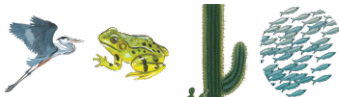
garza sapo cactus peces

¿Cuáles de estos seres vivos no sobrevivirán en el agua o en los pantanos?