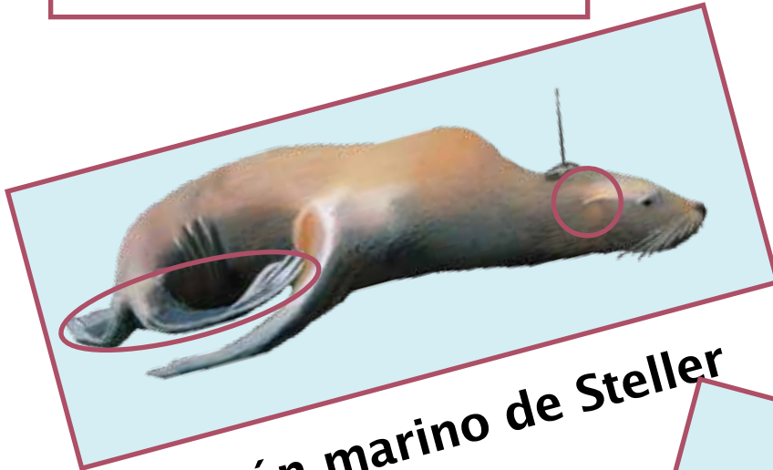
león marino de Steller

Ambos son carnívoros (animales que comen carne).